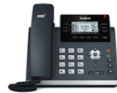
SIP-T42G Multi-function paperless Gigabit IP phone