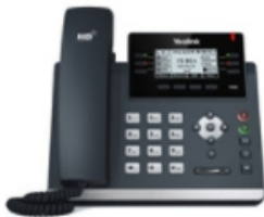
SIP-T42S Ultra-elegant business IP phone