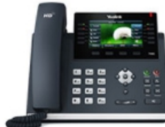
SIP-T46G High-end color screen paperless IP phone