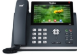
SIP-T48S Ultra-elegant business IP phone