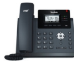
SIP-T40G Ultra-elegant business IP Phone