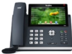
SIP-T48G High-end large screen touch control IP phone