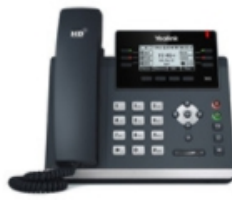
SIP-T41S Ultra-elegant business IP phone