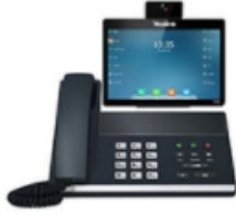
SIP VP-T49G Desktop video phone