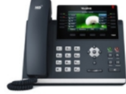
SIP-T46S Ultra-elegant business IP phone